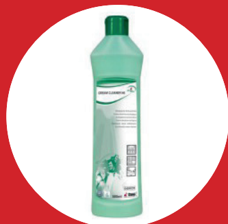
Green Care Cream Cleaner N6West