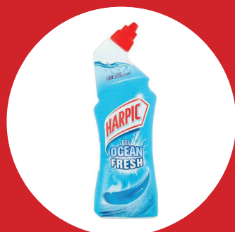
Harpic® Active Fresh Force Océane - Cleaning Gel, Marine Scent

Deze producten kunnen dus mogelijks de gezondheid van werknemers schaden, maar ook die van de klanten bij wie je poetst. Wees je er ook van bewust dat als er andere werknemers werken op de schoonmaakwerplek, je ook met hun syndicale delegatie contact kunt opnemen om dit probleem aan te kaarten. Dat is in het belang van iedereen die ter plaatse is.