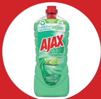
Ajax Citron Vert Multi-Surfaces

Idealiter worden de meeste schoonmaakproducten niet dagelijks gebruikt, omdat vele producten hormoonverstoorders of andere gevaarlijke stoffen bevatten. Dit zijn alvast een aantal voorbeelden van producten waarvan bewezen is of vermoed wordt dat er hormoonverstoorders in vervat zitten, volgens een studie van een doctor in in de wetenschappen en een preventieadviseur over hygiëne op het werk 2 . Maar de andere veelgebruikte producten zijn niet per se minder gevaarlijk. Met deze lijst wil men vooral aantonen dat zelfs de producten die de neus niet prikkelen ook hormoonverstoorders kunnen bevatten.