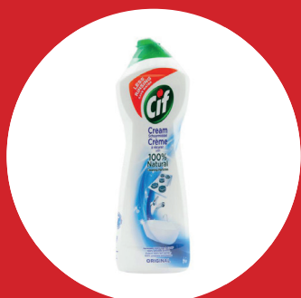
CIF Crème Standard